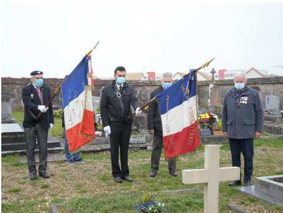
Cérémonie du 11 Novembre en petit comité