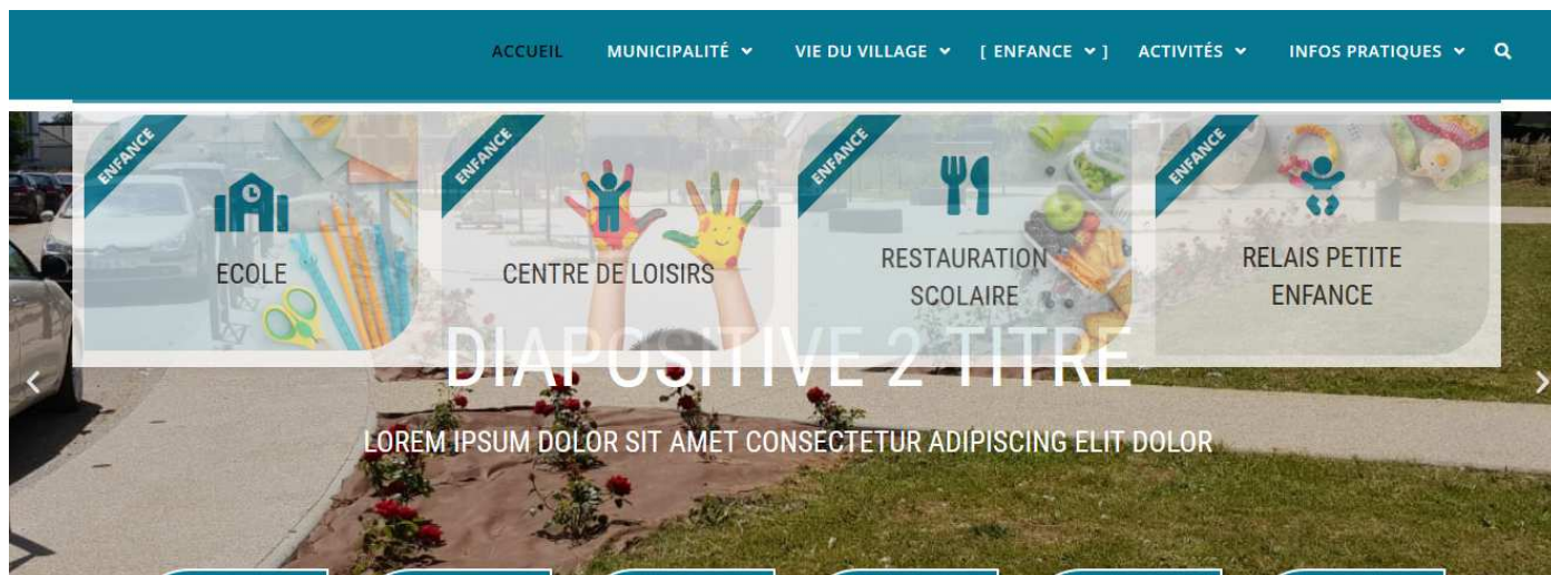
Une partie de la nouvelle page d'accueil

Nous avons aussi décidé de refaire une peau neuve à notre site internet. Nous avons créé un groupe de travail depuis septembre avec des élus mais aussi des habitants de Perrigny que nous remercions énormément pour le temps passé et le travail déjà réalisé. Le site est encore en construction.